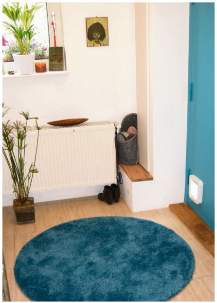
Farben, Formen und Accessoires sollen hier auch an das Meer erinnern