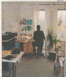
Mit dem Rücken zur Tür – ein Unding nach Feng-Shui. Wie es sein sollte, zeigt die Skizze darüber. GRAFIK: FRANK HASSE

NÄCHSTE CAMPUS-SEITE: DIE PRÜFUNGSANGST BESIEGEN